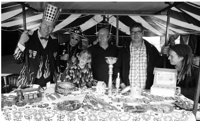
De jury achter de vrolijke koekjestafel, de inzenders hadden er een hoop werk van gemaakt